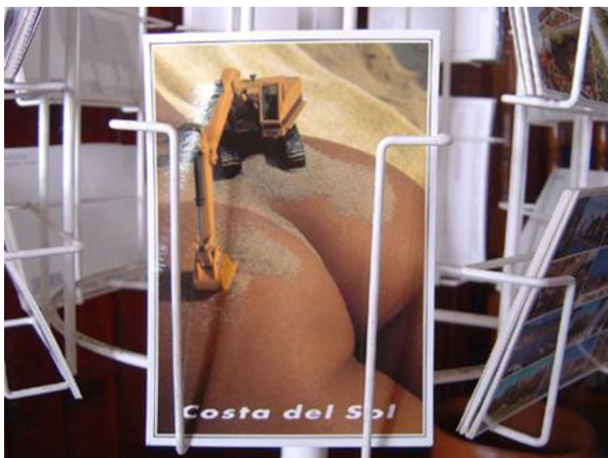
Rogelio López Cuenca. "Nerja Once". (Fotograma). 2004