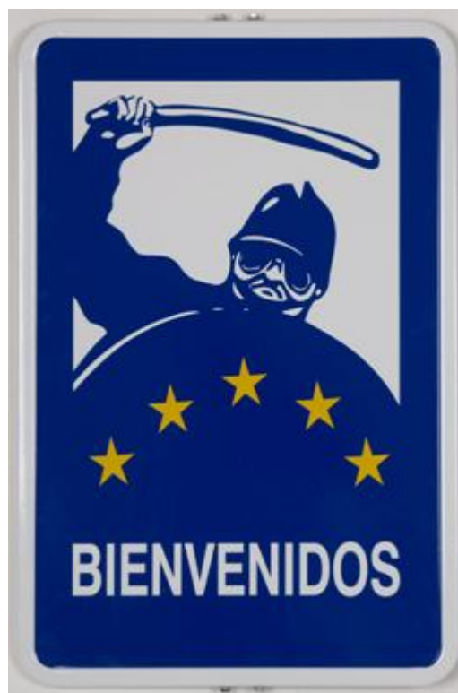
Rogelio López Cuenca. "Bienvenidos". 1998