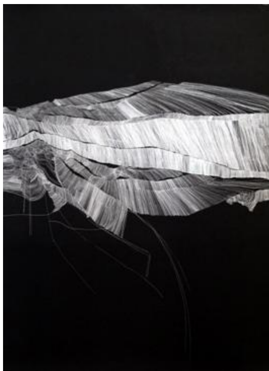
Ruth Morán. Psicografías 2012. Papel, temple vinilico y rotulador de tinta 200x152cm