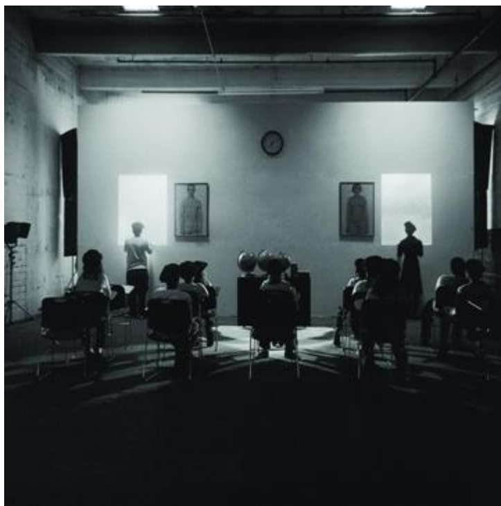
“SERIE CONSTRUCTING HISTORY. A class ponders future (2008)