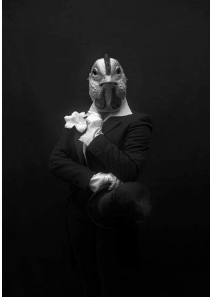
THE LOUISIANA PROJECT. Untitled (2008)