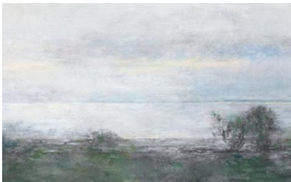
Carmen Laffón. En la Jara. Bajamar. 2008-2013