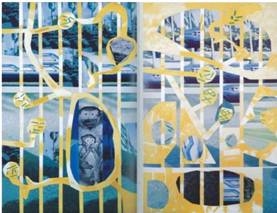
Luis Gordillo. Los Chinos . 1969. Colección Fundación Obra Social Monte de Piedad de Madrid.