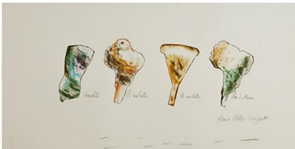
Artista: Bella Geiger. Título: América Latina. 1984.