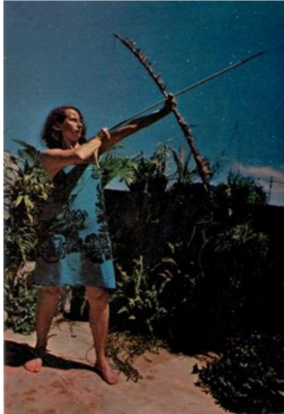
Anna Bella Geiger. Nativo Brasil alienígena. 1977.