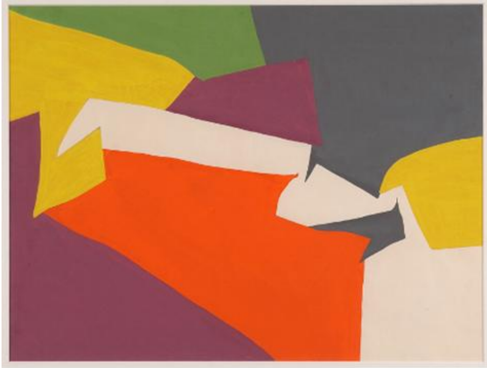
Equipo 57. Sin título . 1957. Colección Centro Andaluz de Arte Contemporáneo.