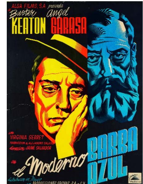
Cartel para la película El moderno Barba Azul , 1946, litografía 97 x 70,5 cm

En México también inició su proyecto más ambicioso: la serie American Way of Life en la que, partiendo de la tradición vanguardista del fotomontaje y del collage, recurre a una estrategia estética; como es la apropiación del lenguaje publicitario y de los medios de comunicación de masas, similar a la que en los años cincuenta y sesenta pusiera en marcha el Pop Art, aunque a diferencia de éste -asegura Jaime Brihuega comisario de la exposición-, el objetivo de Renau siempre estuvo claro: "atacar el corazón mismo del contexto ideológico, económico y político del que estaba brotando el universo de los mass media".