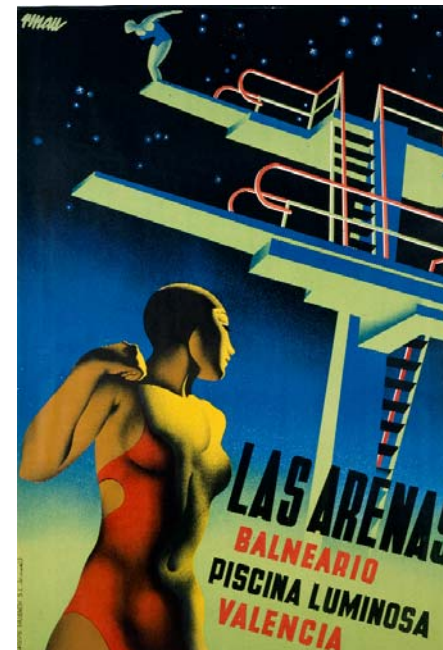
Las Arenas, 1932, aerógrafo, 100 x 70 cm.

Tras la victoria de Franco, Renau se instala en México, donde realiza diversos trabajos como ilustrador y diseñador gráfico, colabora en varias publicaciones del exilio español, e inicia una fructífera actividad como muralista. Su obra mural más emblemática es España hacia América , un gran friso de algo más de cuatro metros de altura y treinta de longitud en el que representa en clave alegórica algunos hitos de la historia de España.