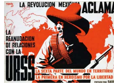
La Revolución Mexicana aclama la reanudación de relaciones con la URSS, 1942, litografía, 33 x 45,2 cm

En los años de la guerra civil, Josep Renau desarrolla una incesante actividad de agit prop en defensa de la España republicana: realiza numerosos carteles y fotomontajes propagandísticos; promueve intensos debates públicos en torno al sentido del arte y el papel de los artistas en tiempos de crisis; y asume sucesivamente los cargos "políticos" de codirector del periódico La Verdad , director general de Bellas Artes y director de la oficina de Propaganda Gráfica del Comisariado General del Estado Mayor Central del Ejército.