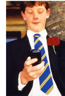
Martin Parr, Gran Bretaña , de la serie Agenda telefónica , 2002