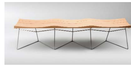
Banco, 1960, Madera de haya y acero inoxidable

El Equipo 57 genera diferentes pinturas y esculturas que van evolucionando, las primeras desde una preponderancia de líneas rectas y curvas para separar los diferentes colores planos hasta una concepción serial