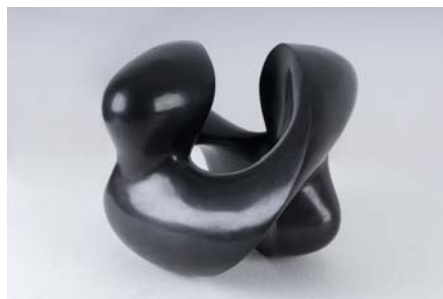
Sin título, 1959, Bronce patinado en negro

de un nuevo origen" (1). A esta actitud corresponde la formación de grupos de investigación tales como Arte Concreta , en Milán, Espace en París, Exat en Zagreb, Gutai en Japón, Equipo 57 en España, Grupo Zero en Alemania, etc. Las investigaciones desarrolladas por estos colectivos se pueden considerar como intentos de ruptura con el tipo de narración dramática propia de los expresionismos individualistas.